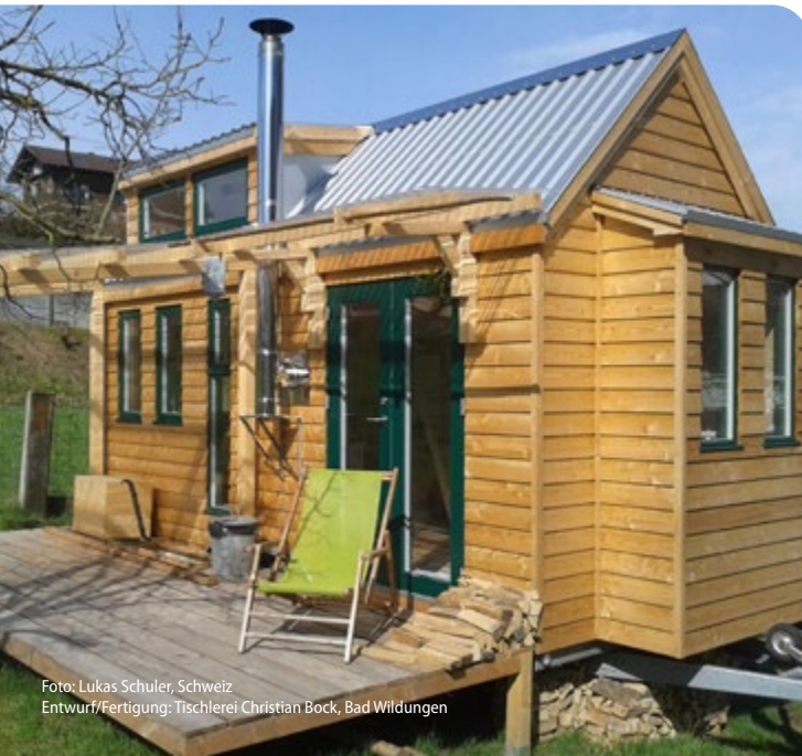
Entwurf/Fertigung: Tischlerei Christian Bock, Bad Wildungen

wandel.WOHNPAK Braunschweig ist eine Projektgruppe der Regionalen Energie- und KlimaschutzAgentur e.V. (reka)